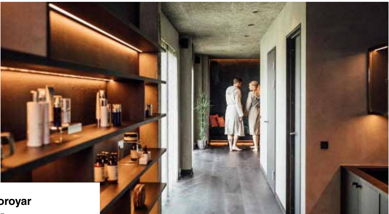
Hotel Foroyar FEROE 4 ESTRELLAS DELUXE SEA VIEW ROOM