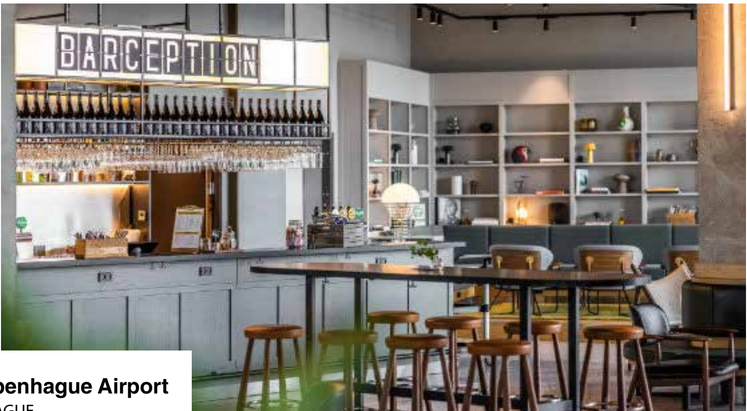
Comfort Hotel Copenhagen Airport COPENHAGUE 3 ESTRELLAS STANDARD ROOM